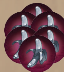
18 жетонов примативных инструментов 6 шестерёнок, 6 гаечных ключей и 6 бананов