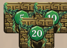
3 жетона кампании