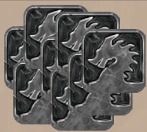
8 жетонов вращений бесчисленных механизмов (вращений)