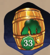
Артефакт ценностью 33 очка