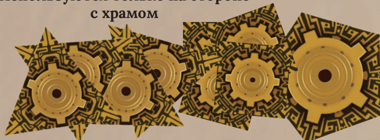
9 фрагментов механизма

4 треугольных, 4 квадратных, 1 пятиугольный