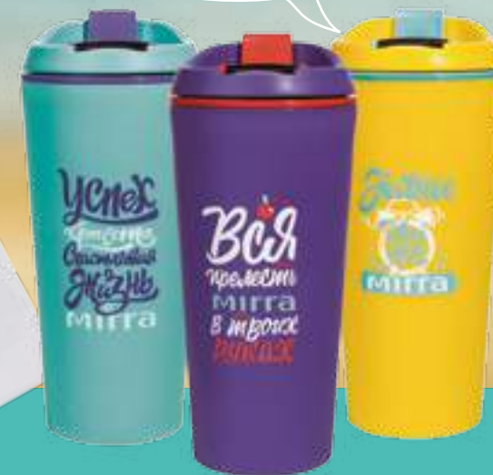
БРЕНДИРОВАННЫЙ АКСЕССУАР (ТЕРМОСТАКАН)

Экостакан сохранит напиток холодным или горячим, не обжигая ваши руки. Материал изготовления безопасен для эндокринной системы и подлежит повторной переработке.