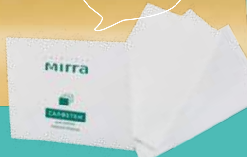
САЛФЕТКИ ДЛЯ СНЯТИЯ ЖИРНОГО БЛЕСКА

Удобный набор салфеток легко носить с собой и использовать при необходимости.