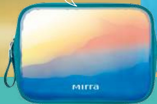
КОСМЕТИЧКА «МОРСКОЙ КРУИЗ» /БОЛЬШАЯ/

Вместительная косметичка для самых необходимых средств ухода. Отлично подходит для путешествий или хранения косметики.