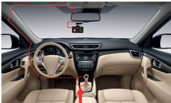
Автомобильная розетка (прикуриватель)

Пример установки кабеля питания, изображенный на картинке, рекомендован как наиболее безопасный, так как кабель не будет закрывать поле зрения водителя и отвлекать его от вождения.