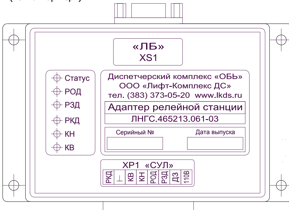
Рис. 2. Внешний вид адаптера релейной станции

1.4.3.3. На печатной плате адаптера релейной станции находятся разъемы: