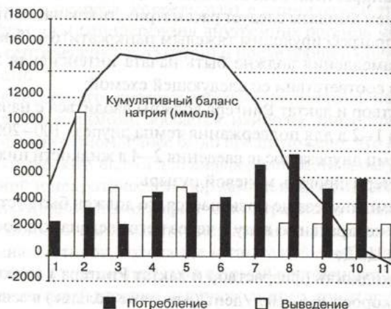
Рис. 7.1. Балансы жидкости и натрия у пациентов с неосложненным панкреатитом