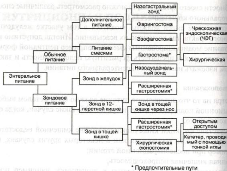
Рис. 4.1. Пути введения энтерального питания

можно разработать оптимальную схему нутриционной поддержки персонально для каждого пациента. Подробная информация дана ниже.