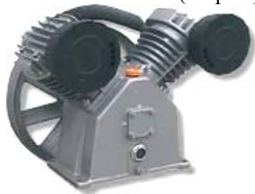
Узел насоса LB50 (старый)