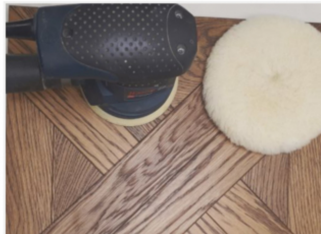
тонированные поверхности с брашем белый ПАД с ворсом