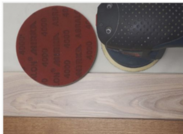
тонированные поверхности без брашировки Abralon P4000