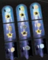
18 жетонов хвостов