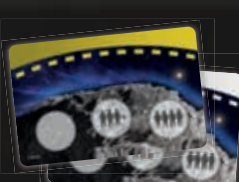
2 двусторонние карты поверхности