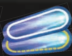
2 двусторонних жетона комет