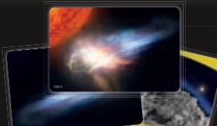
3 карты проверки

Выполните описанные ниже шаги, чтобы добавить дополнение «Кометы» в игру.