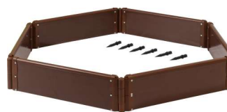
6 секций (2 комплекта)