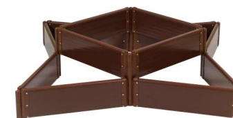
12 секций (4 комплекта)