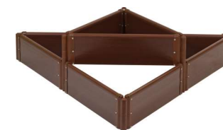
9 секций (3 комплекта)