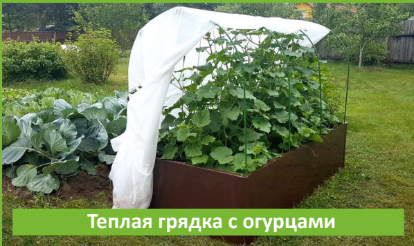
Теплая грядка с огурцами