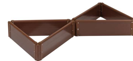
6 секций (2 комплекта)

Производитель: ООО «Экологические Технологии», 170100, г. Тверь, ул. Индустриальная, д.13, телефон: +7 (4822) 35-88-44, мобильный: +7 (920) 177-60-87, сайт: rnw.ru , e-mail: sad@rnw.ru