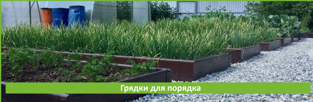
Грядки для порядка