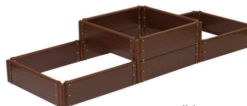
12 секций (4 комплекта)