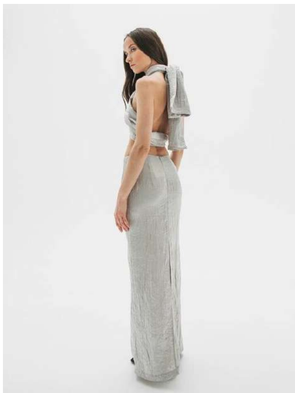
ИЗ ЖАТОЙ ВИСКОЗЫ