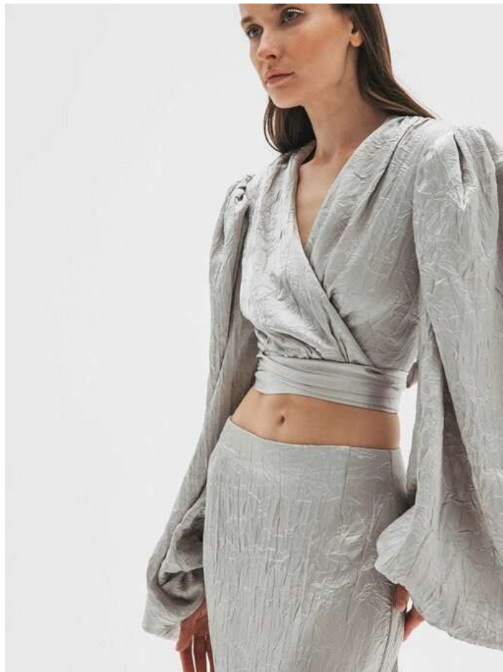
ИЗ ЖАТОЙ ВИСКОЗЫ