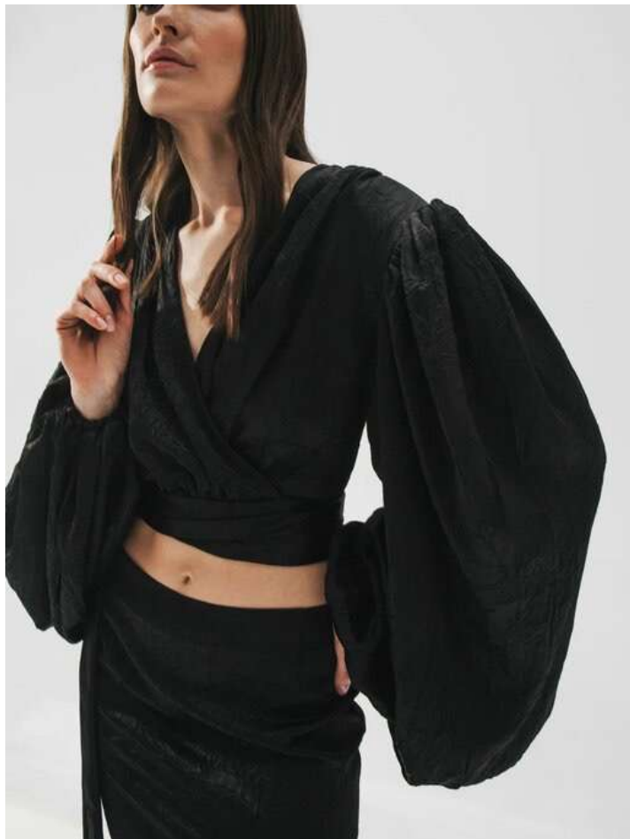
ИЗ ЖАТОЙ ВИСКОЗЫ