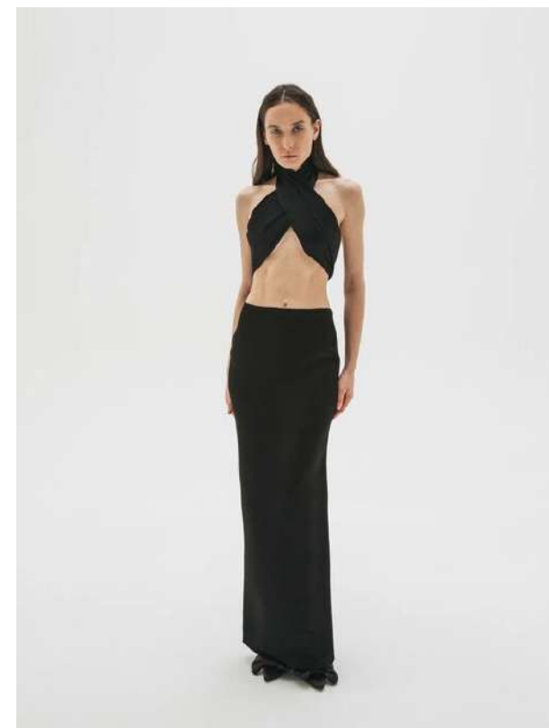
ИЗ ЧЕРНОЙ ВИСКОЗЫ