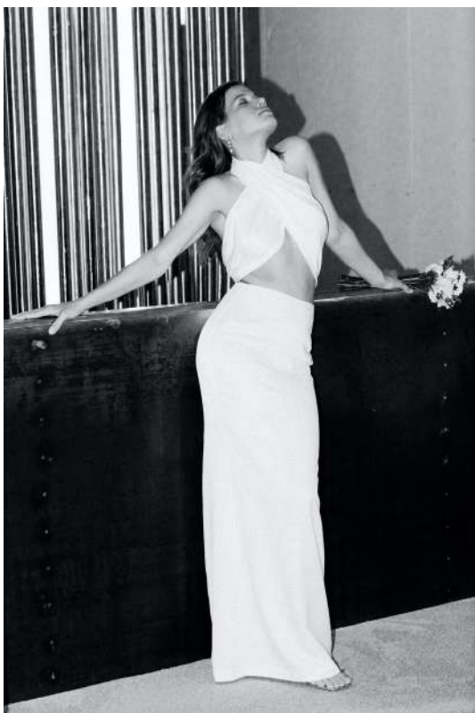
ИЗ МОЛОЧНОЙ ВИСКОЗЫ