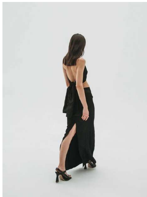
ИЗ ЖАТОЙ ВИСКОЗЫ