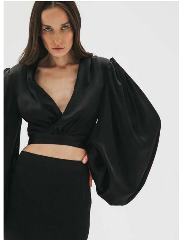
ИЗ ГЛАДКОЙ ВИСКОЗЫ