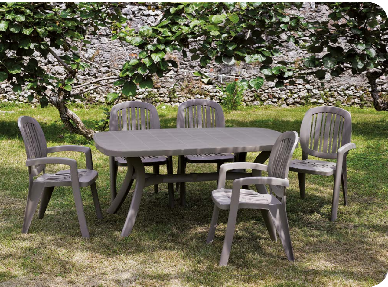
toscana 165 tortora