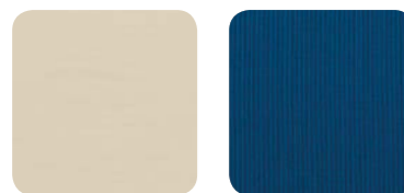
écru .160 220 gr/m² blu .076 220 gr/m²

100% Olefin tintada en masa. Tratamiento con resina de poliuretano / acrílico, repelente al agua. Solidez a la luz 7/8. Desenfundable/zip. Lavable a 40°. Relleno: espuma de poliuretano. Densidad 18 kg/m³. 100% Olefin tingida em massa. Tratamento com resina de poliuretano / acrílico, hidrorepelente. Resistência à luz 7/8 Removível/zip. Lavável a 40°. Enchimento: espuma de poliuretano. Densidade 18 kg/m³. 100% Olefin çözültü halindeyken boyanmış. Poliüretan reçine/akrilik ile muamele edilmiş, su itici. Işık hızlığı 7/8. Çıkarılabilir/fermuar, 40°de yıkanabilir. Dolgu malzemesi: poliüretan köpük. Yoğunluk 18 kg/m³. 100% Olefin, окрашенный в массу. Обработка полиуретановым/акриловым полимером, водоотталкивающая. Светостойкость 7/8. Съемная обивка/с молнией, стирать при 40°. Набивка: Пенополиуретан. Плотность 18 кг/м³.