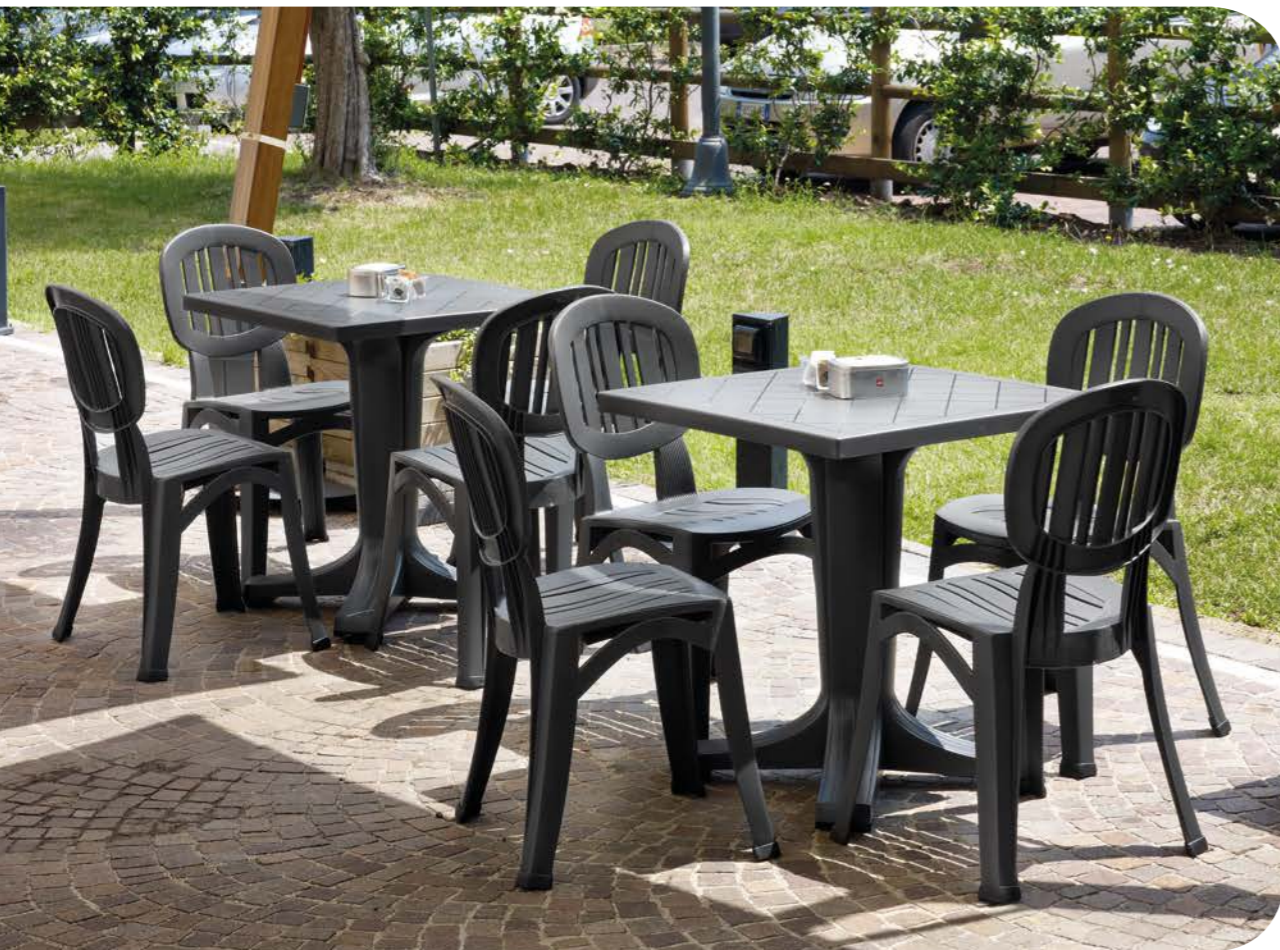
giove 80 antracite