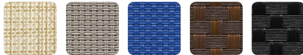
beige 1x1 .105 tortora 2x2 .124 blu 2x2 .112 trama caffè .117 trama antrac. .116

Tejido en hilo de poliéster recubierto de pvc. Tecido de fibra polyester com cobertura pvc. PVC kaplı polyester elyaf tekstil. Ткань из полиэфирных нитей с покрытием из ПВХ.