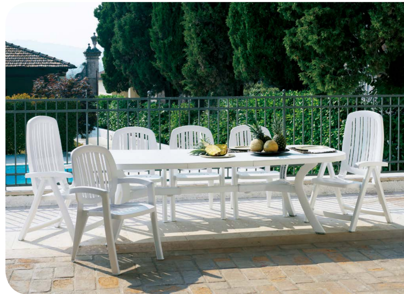
toscana 250 bianco