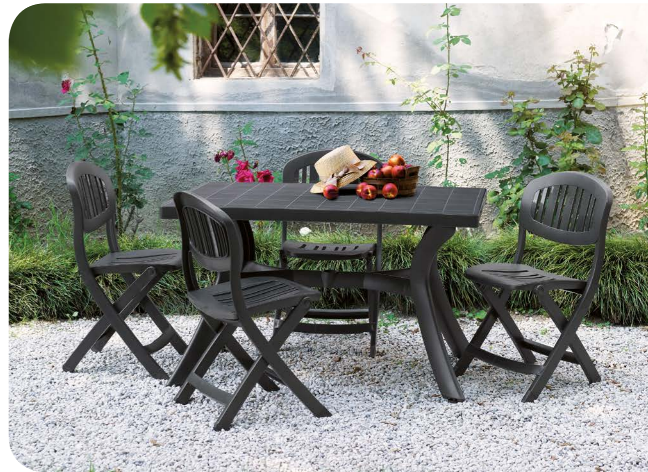
toscana 120 antracite