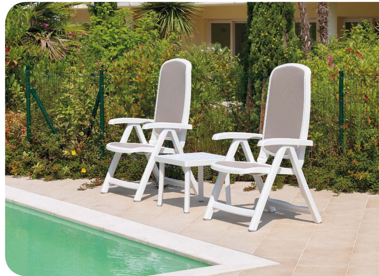
delta bianco Tortora