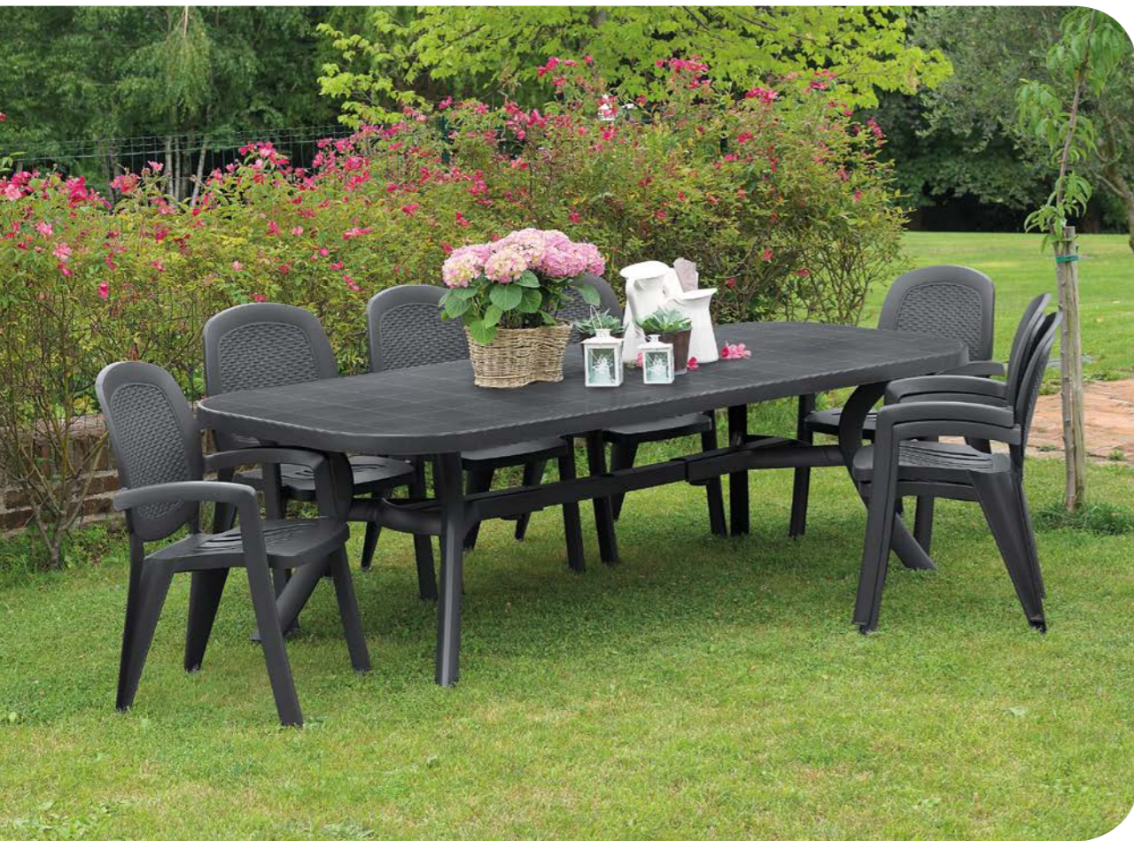
toscana 250 antracite