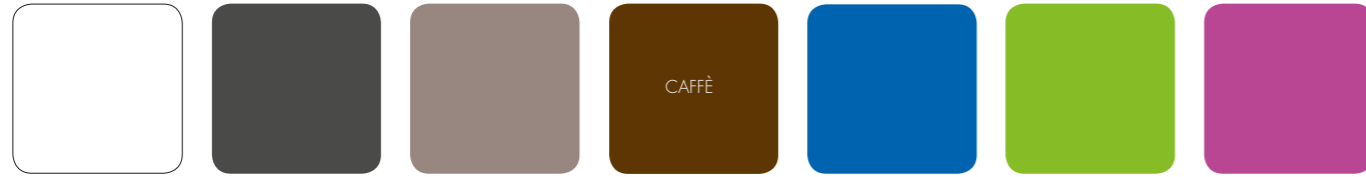
BIANCO .00 ANTRACITE .02 TORTORA .10 CAFFÈ .05 AZZURRO .19 LIME .12 PURPLE .13

Polipropileno com tratamento anti-UV colorido na totalidade. Resina reciclável 100%. Işığa dayanıklı ve boyalı olarak granül çekilmiş %100 geri dönüşümlü polipropilen kompozit hammaddede. Полипропилен с обработкой анти-УФ, окрашенное в массу. На 100% пригодно для вторичной переработки.