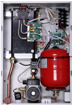
Внутренний вид котла Nobby Electro KBO