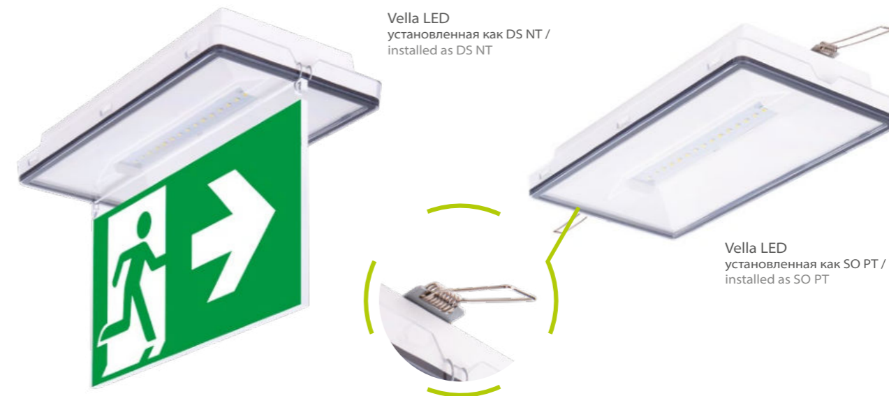
Vella LED установленная как DS NT / installed as DS NT