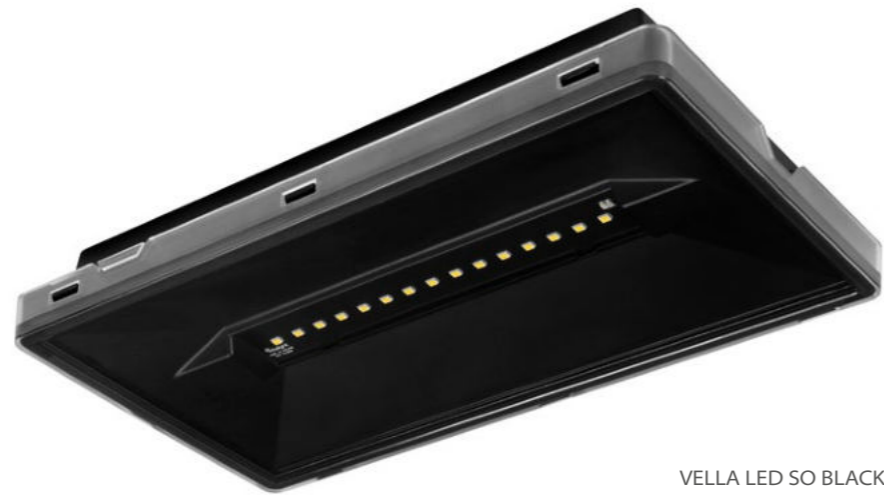
VELLA LED SO BLACK