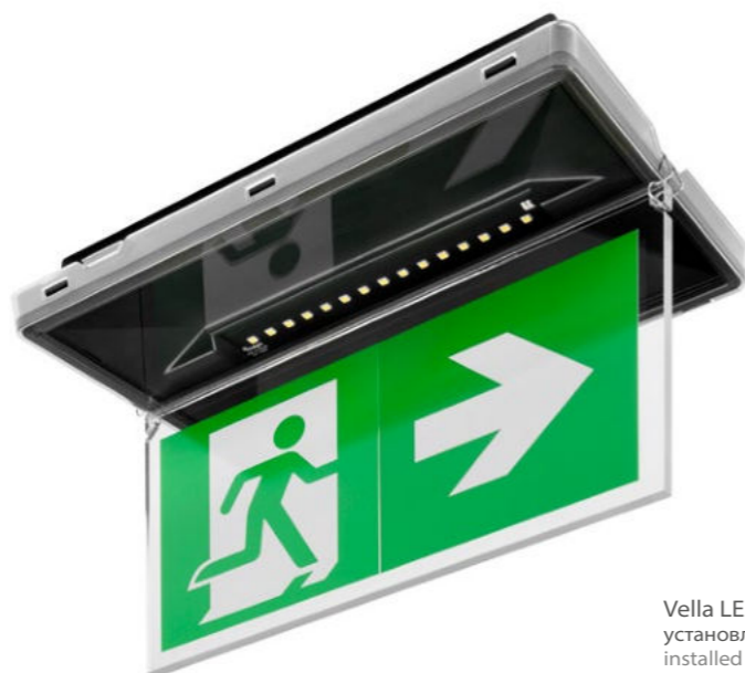
Vella LED Black установленная как DS NT / installed as DS NT