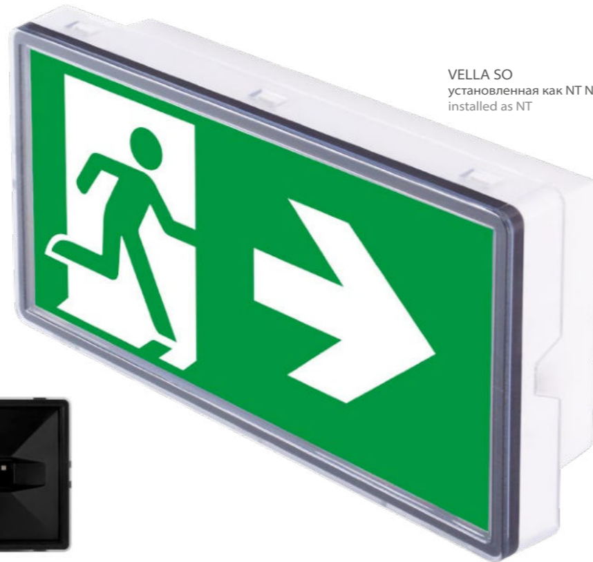
VELLA SO установленная как NT NT / installed as NT