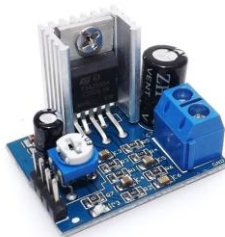
Общий вид устройства

Простой и надежный усилитель НЧ класса Hi-Fi. Обладает минимальным коэффициентом нелинейных искажений и уровнем собственных шумов. Модуль имеет компактные размеры, что позволяет его встраивать в любые DIY устройства. А так же, применять его в качестве альтернативного усилителя в процессе ремонта бытовой или промышленной электроники.