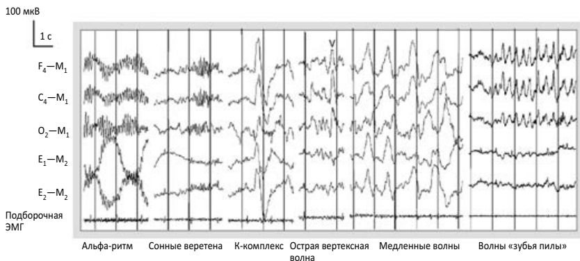
Рис. 2. Различные варианты активности ЭЭГ (Berry R. B., 2012)

Острые вертексные волны представляют собой узкие (менее 500 мс) колебания, максимально выраженные в отведениях, содержащих электроды, расположенные в области вертекса ( C_2 , C_3 , C_4 ). Нередко эти волны выявляются при переходе от стадии N_1 к N_2 .