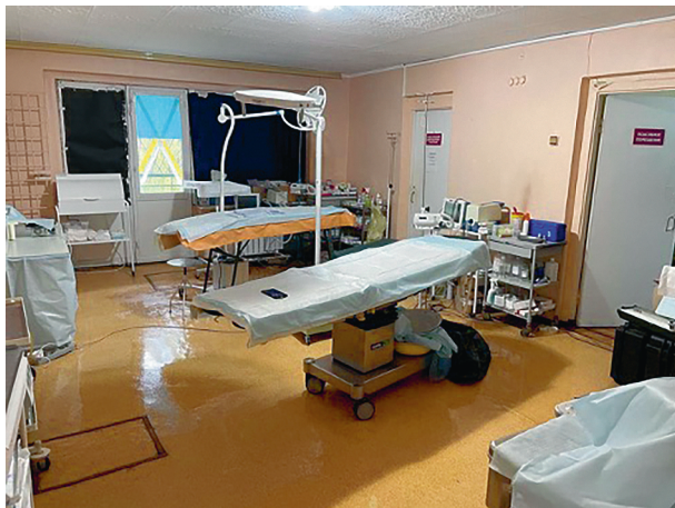
Рис. В.2. Помещение, приспособленное под операционную