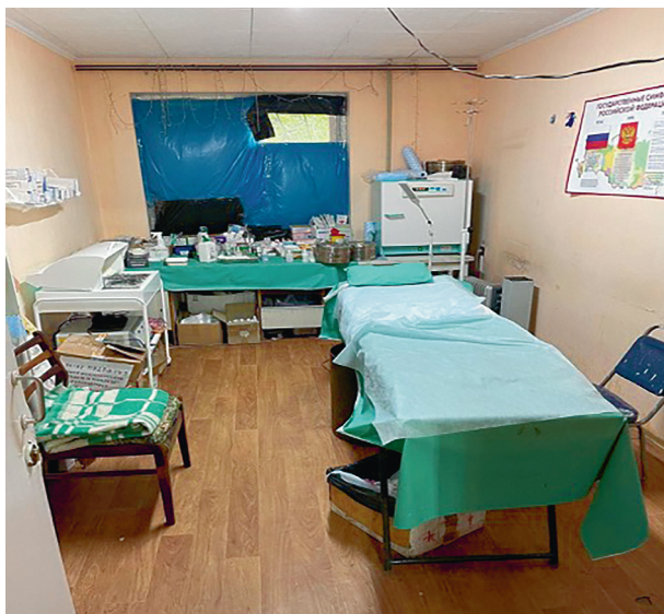
Рис. В.1. Приспособленное помещение для проведения перевязок и манипуляций

Горький опыт событий в Беслане, Южной Осетии, Донецкой Народной Республике показывает, что в операционных, как правило, хватает оперирующих хирургов (привлекают специалистов хирургического профиля: урологов, сосудистых хирургов и т.п.), но заметен дефицит анестезиологов-реаниматологов, которым приходится обеспечивать подготовку раненых к операции [инфузионно-трансфузионную терапию (ИТТ), премедикацию], проводить анестезиологическое пособие одновременно на 2–3 столах, следить за послеоперационным обезболиванием и наблюдать за состоянием раненых. Анестезиологам не поможет никто: слишком узкие специализация и направленность!