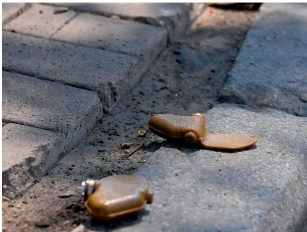
Рис. 1.2. Мина ПФМ-1 («Лепесток»)

взрывной волны значительной интенсивности на организм пострадавшего. При срабатывании мины ПФМ-1 («Лепесток») (рис. 1.2) пластмассовые осколки не идентифицируются рентгенологически.