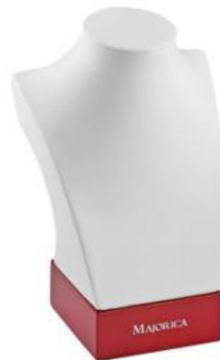
Малый бюст из искусственной кожи 18.7 x 8 x 7.8 см