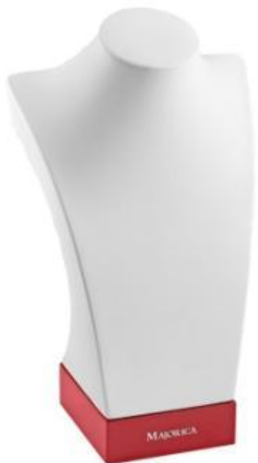
Большой бюст из искусственной кожи 28.49 x 9 x 9.6 см