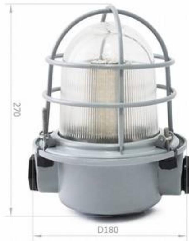
Рисунок 1 – Внешний вид светильника.

Внешний вид и габаритные размеры светильника представлены на рисунке 1.