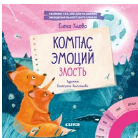
Компас эмоций. Злость

Идеальные книги для знакомства с основами эмоционального интеллекта и способами его развития. Терапевтические сказки и полезные упражнения помогут вашему ребенку стать хозяином своих эмоций.