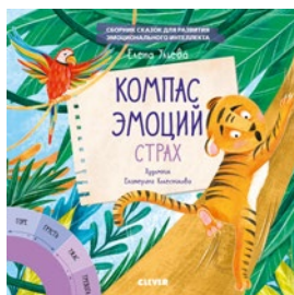
Компас эмоций. Страх