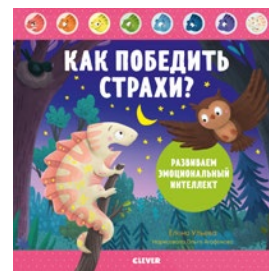
Как победить страхи?