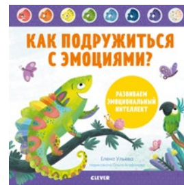
Как подружиться с эмоциями?