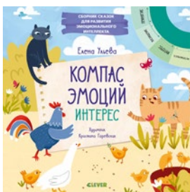
Компас эмоций. Интерес