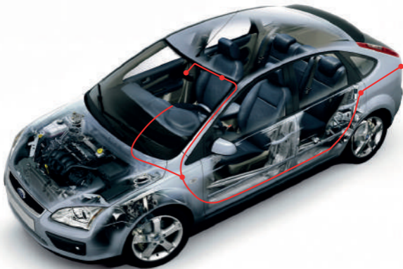
Рисунок ниже показывает пример подключения выносной камеры. Установите камеру в задней части салона автомобиля так, чтобы она не мешала Вам, и при этом был достаточный обзор для съёмки. Подключите камеру к разъёму на корпусе TrendVision DriveCam Signature.