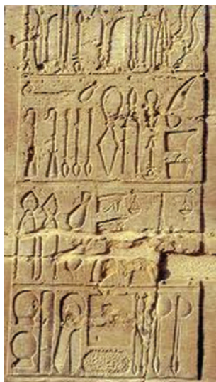
Рис. 1. Медицинский инструмент. Египет (4–6 тыс. до н. э.) ( http://historicmysteries.com/the-practice-of-medicine-and-dentistry-in-ancient-egypt )

С именем Гиппократ связана одна из классических бинтовых повязок на голову (шапочка Гиппократ). Имеются также сведения и об использовании в те времена специальных устройств и повязок для вытяжения, применявшихся при лечении переломов и исправлении различных искривлений позвоночника и конечностей.