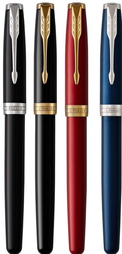
Основной ассортимент с пером из золота 18K 4 отделки