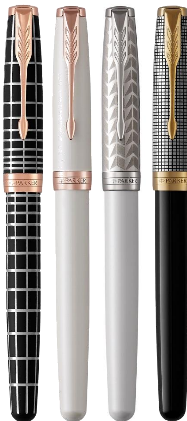
Престижный ассортимент 4 отделки