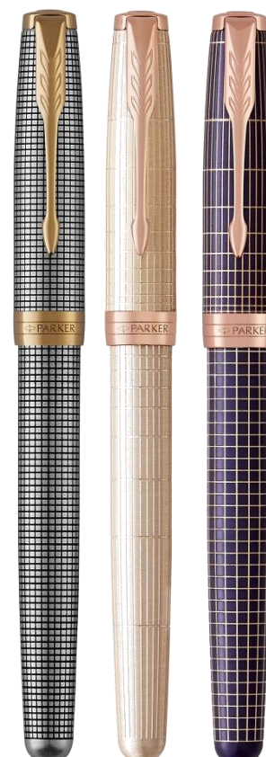
Ассортимент люкс, выполненный из серебра 3 отделки. Поступят к нам в ноябре 17