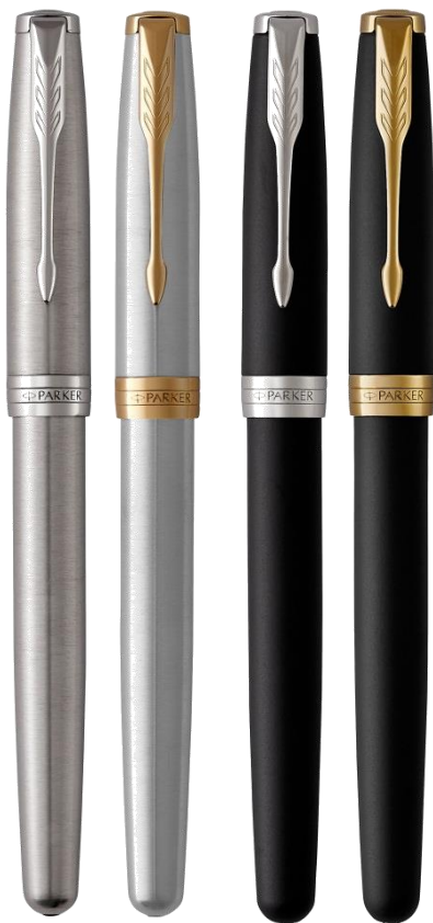
Основной ассортимент со стальным пером 4 отделки