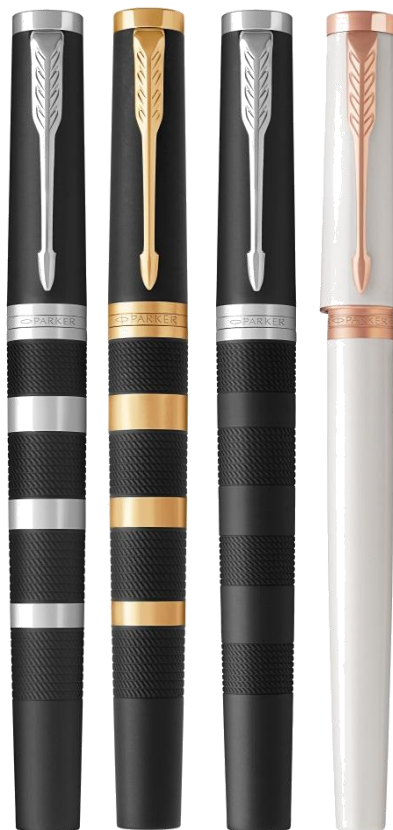
Премиальный ассортимент 4 отделки