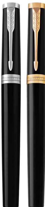
Ключевой ассортимент 2 отделки