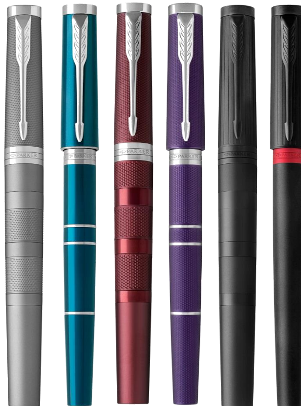
Ассортимент люкс 6 отделок