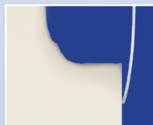
Матрицы с неплотным прилеганием в пришеечной области.

Матрица, которая неплотно прилегает к краям полости под контактным пунктом, может вызвать формирование нависающих краев пломбы, которые не всегда выявляются при контрольном осмотре пломбы с помощью зонда или флосса. С течением времени под действием окклюзионной нагрузки происходит скол нависающей части пломбы, что создает условия для скопления пищи и зубного налета. Системы секционных матриц, состоящие из матрицы, клина и кольца, могут создавать риск вытекания материала из-за недостаточно плотного прилегания матрицы вследствие небольшого давления, оказываемого клином на матрицу при фиксации ретенционного кольца для сепарации зубов.