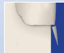
Скол нависающих краев пломбы.