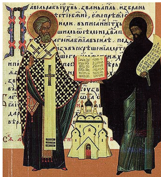
Св. равноап. Мефодий и Кирилл. Миниатора из церковнославянской книги

Христианство на Руси было принято в 988 году при святом князе Владимире.