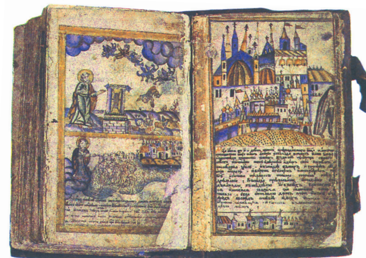
..... Древняя книга

И к рукописным, и к печатным книгам относились трепетно. Их очень ценили, но не только потому, что они дорого стоили, а ещё потому, что большинство из них использовалось в богослужении: Часослов, Евангелие, Псалтирь. Кстати, знаете ли вы, что основным учебником