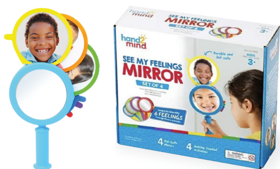
Зеркало эмоций «Моё настроение» Артикул WB: 154697457

Перед вами 2 обучающих пособия, которые позволят ребёнку взглянуть на себя со стороны и, как следствие, лучше понимать других :