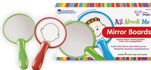
Зеркало эмоций «Пиши и стирай» Артикул WB: 150419236