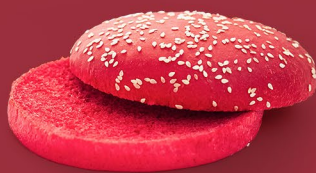
Томатная с кунжутом