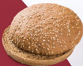
Ржаная с кунжутом