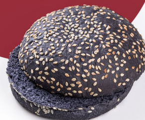
С чернилами каракатицы