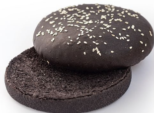
Черная с кунжутом