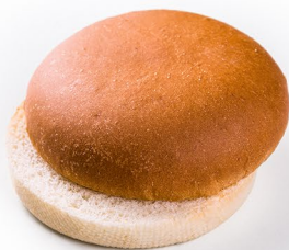
Пшеничная без кунжута

Готовность: Полностью готовый продукт, заморожен Рекомендации: Перед употреблением разморозить при комнатной температуре в течение 20-30 минут, после этого, для разогрева можно использовать тостер, духовую печь или контактный гриль