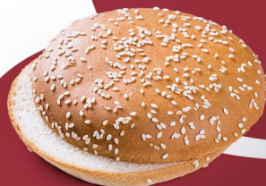
Пшеничная с кунжутом