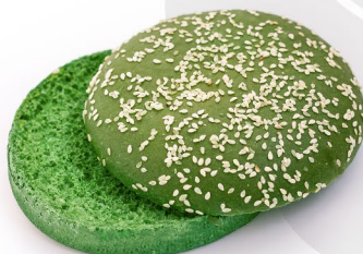
Шпинатная с кунжутом