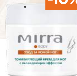
ТОНИЗИРУЮЩИЙ КРЕМ ДЛЯ НОГ с охлаждающим эффектом арт. 3385 | 50 мл 499 руб. 449 руб.