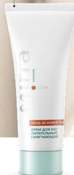
КРЕМ ДЛЯ НОГ ПИТАТЕЛЬНЫЙ СО СМЯГЧАЮЩИМ ЭФФЕКТОМ арт. 30380 | 75 мл 568 руб.