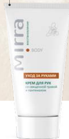
КРЕМ ДЛЯ РУК ВОССТАНАВЛИВАЮЩИЙ со священной травой и пантенолом арт. 98314 | 30 мл 208 руб.