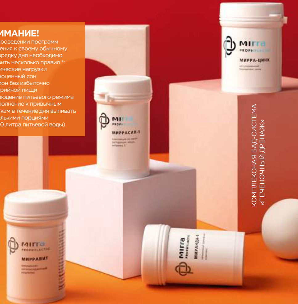
КОМПЛЕКСНАЯ БАД-СИСТЕМА «ПЕЧЕНОЧНЫЙ ДРЕНАЖ»

При проведении программ очищения к своему обычному распорядку дня необходимо добавить несколько правил*: • физические нагрузки • полноценный сон • рацион без избыточно калорийной пищи • соблюдение питьевого режима (в дополнение к привычным напиткам в течение дня выпивать несколькими порциями 0,5 - 1,0 литра питьевой воды)