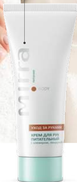
КРЕМ ДЛЯ РУК ПИТАТЕЛЬНЫЙ с клевером, люцерной и мумие арт. 30460 | 75 мл 439 руб.