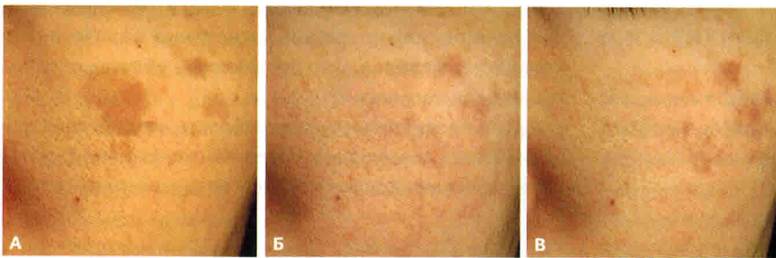
Рис. 1. Лентиго до коррекции (А), через 1 мес (Б) и через 3 мес (В) после 1-й процедуры: осветление 75–94% [5]

Авторы делают вывод, что использование пикосекундного лазера с двумя длинами волн для удаления пигментных дефектов у пациентов с темными фототипами