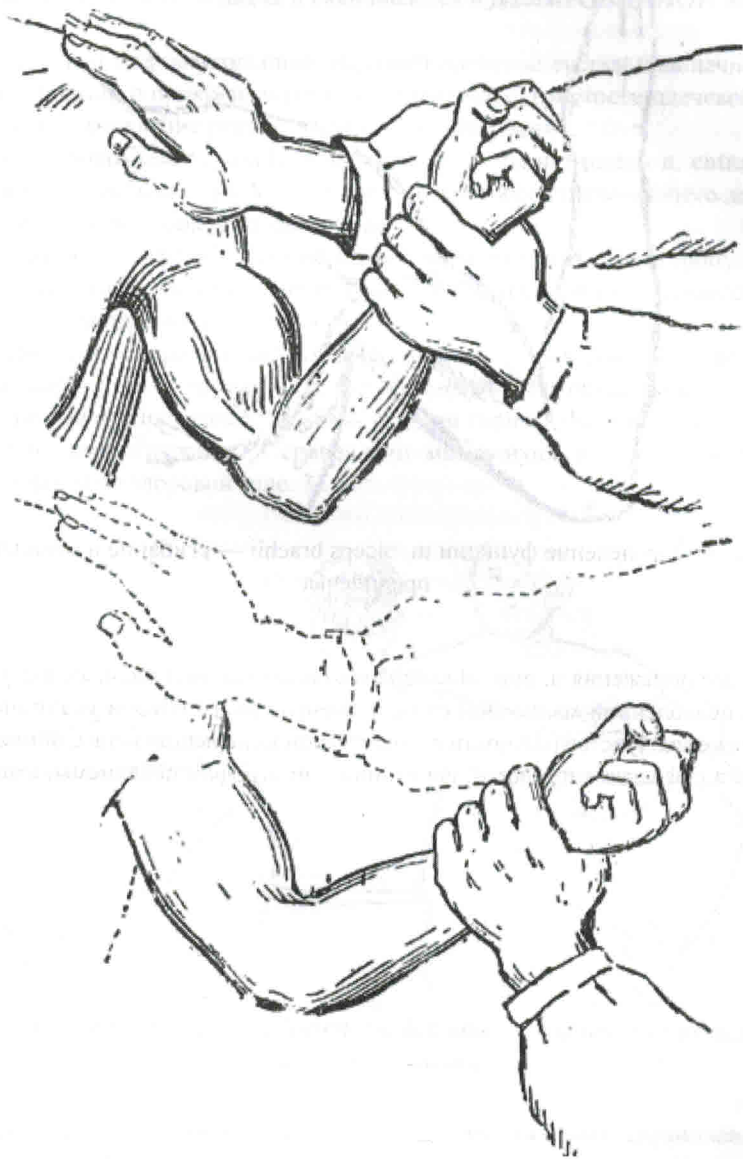
Рис. 1. Определение мышечной силы mm. biceps, brachialis — сгибание предплечья

При определении мышечной силы исследователь оказывает больному сопротивление; только не следует употреблять слишком большого усилия, а наоборот, постепенно ослаблять его, чтобы заметить даже незначительное понижение силы. Сравнивают мышечную силу и объем выполняемого движения со здоровой стороной.