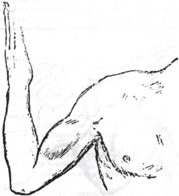
Рис. 2. Определение функции m. biceps brachii — сгибание и супинация предплечья

Диагноз поражения n. musculocutaneus становится достоверным в случае обнаружения ослабленной мышечной силы и уменьшенного объема указанных движений, понижения чувствительности в зоне кожной иннервации нерва, понижения или отсутствия рефлекса с m. biceps , гипотонии или атрофии переднемышечных групп плеча.