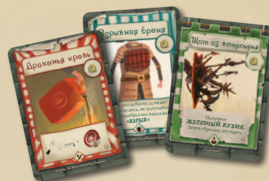
24 КАРТЫ СНАРЯЖЕНИЯ