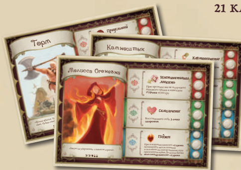
4 ПЛАНШЕТА ГЕРОЕВ