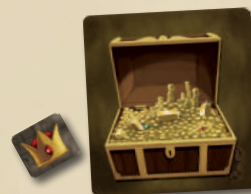
ЖЕТОН ВОЖАКА ЖЕТОН СУНДУКА