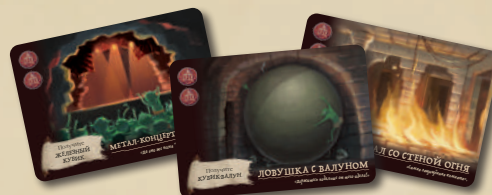
21 КАРТА ПОДЗЕМЕЛЯ