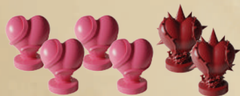
4 ФИШКИ ЗДОРОВЬЯ ГЕРОЕВ 2 ФИШКИ ЗДОРОВЬЯ МОНСТРА