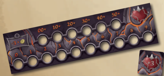
ШКАЛА ЖИВУЧЕСТИ МОНСТРА ЖЕТОН РЕЖИМА СЛОЖНОСТИ