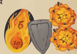
4 НАКЛАДКИ (1 ШАР ОГНЯ, 1 БРОНЯ, 2 ВЗРЫВА)