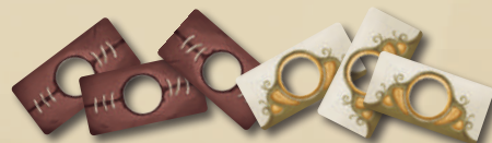
12 ЖЕТОНОВ ШРАМОВ / УЛУЧШЕННЫХ СПОСОБНОСТЕЙ