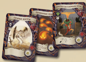
21 КАРТА МОНСТРОВ