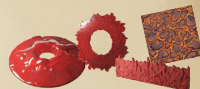
1 ВУЛКАН, 1 КОЛЬЦО ОГНЯ, 1 СТЕНА ОГНЯ, 1 ЛАВОВЫЙ КОВЁР