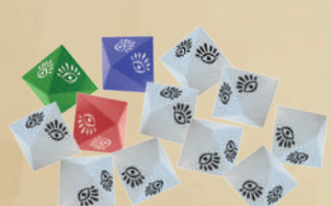
12 ВОСЬМИГРАННЫХ КУБИКОВ (3 ЦВЕТНЫХ + 9 БЕЛЫХ БОНУСНЫХ)