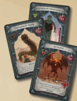
3 КАРТЫ БОССОВ