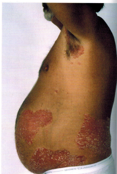
Рисунок З. Сочетание обычного псориаза и псориаза кожных складок, поразившего подмышечные впадины.