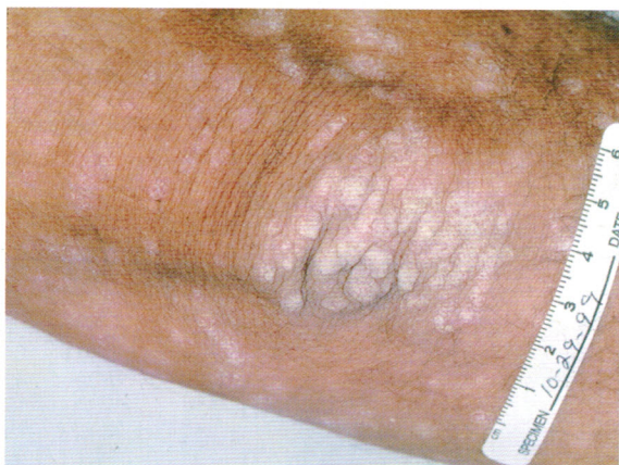
Рисунок Е. Псориазная бляшка на локте, покрытая толстыми чешуйками.