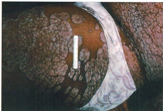
Рисунок Ж. Тяжелый псориаз.