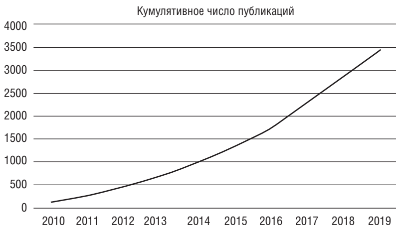
Рис. 1.1. Общее количество цитирований по ключевому слову «ортогериятрия» в Google Scholar

драматичные внезапные демографические изменения, с которыми столкнется мир (Таиланд выбран в качестве наиболее яркого примера).