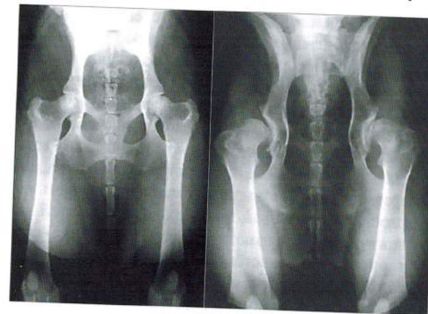
Рис. 22.1. Дисплазия тазобедренных суставов

В этиологии и патогенезе развития врожденного вывиха бедра имеют значение такие факторы, как недоразвитие вертлужных впадин, слабость сухожильно-мышечного аппарата тазобедренного сустава, раннее