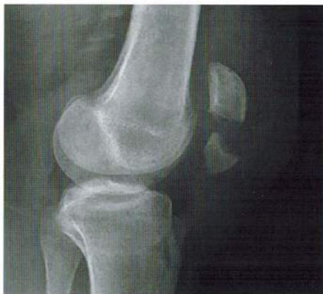
Рис. 14.3. Перелом надколенника (боковая проекция)

Обязательно проводят рентгенологическое исследование коленного сустава в двух стандартных проекциях (переднезадняя и боковая проекции). Боковая проекция позволяет уточнить диагноз (рис. 14.3).