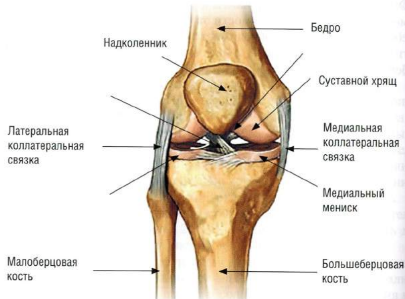
Рис. 14.1. Схема строения коленного сустава

Медиальный и латеральный мениски — клиновидные полулунные волокнисто-хрящевые диски, находящиеся внутри коленного сустава