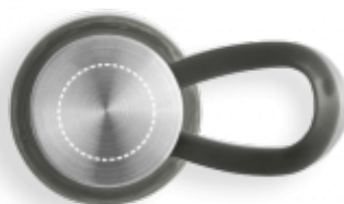
ЛАЗЕР Термос | На крышке от бутылки ∅ 30 mm