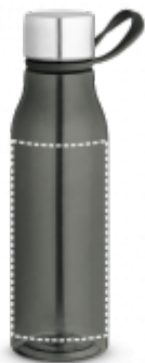
ЦИЛИНДРИЧЕСКИЕ УФ ПЕЧАТЬ Термос | Корпус 200 x 140 mm