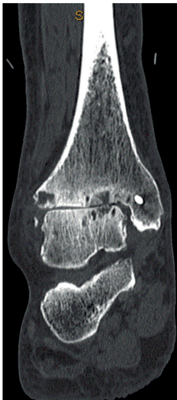
Рис. 1.5. Клинический пример, предоперационное КТ-изображение в переднезадней проекции