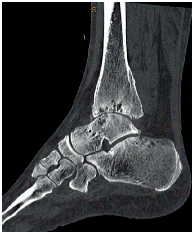
Рис. 1.3. Клинический пример, предоперационное КТ-изображение в боковой проекции