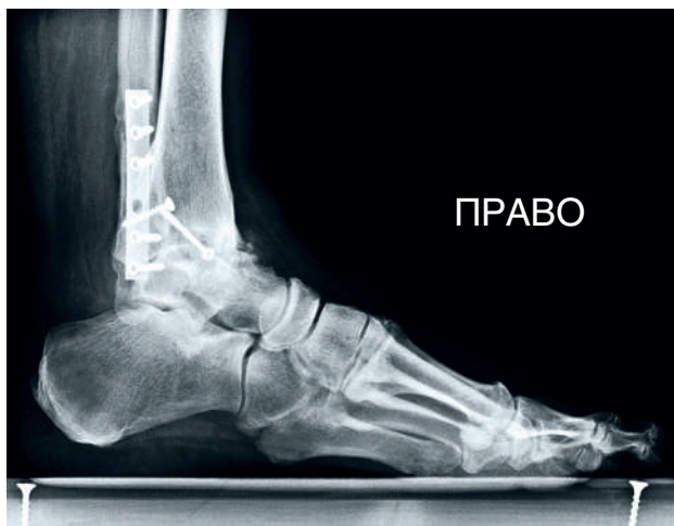
Рис. 1.2. Клинический пример, предоперационная рентгенограмма голеностопного сустава в боковой проекции

После конференции документы и записи, касающиеся планирования операции, отправляют в операционную. В операционной на негатоскопе (или другом удобном месте) закрепляют заявку на операцию, необходимые клинические данные, план операции и последние снимки. В ходе операции к этим документам может обратиться любой задействованный сотрудник (рис. 1.2–1.7). Во время процедуры «тайм-аута» все присутствующие в операционной проверяют снимки, заявку на операцию, клинические данные, согласие, маркировку конечности и данные на идентификационном браслете пациента. Это последняя проверка безопасности перед началом операции. На этом этапе вся хирургическая бригада имеет возможность еще раз изучить план операции.