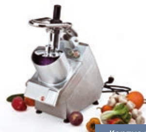
Корпус из нержавеющей стали