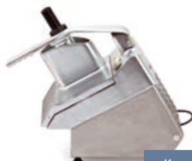
Корпус из нержавеющей стали