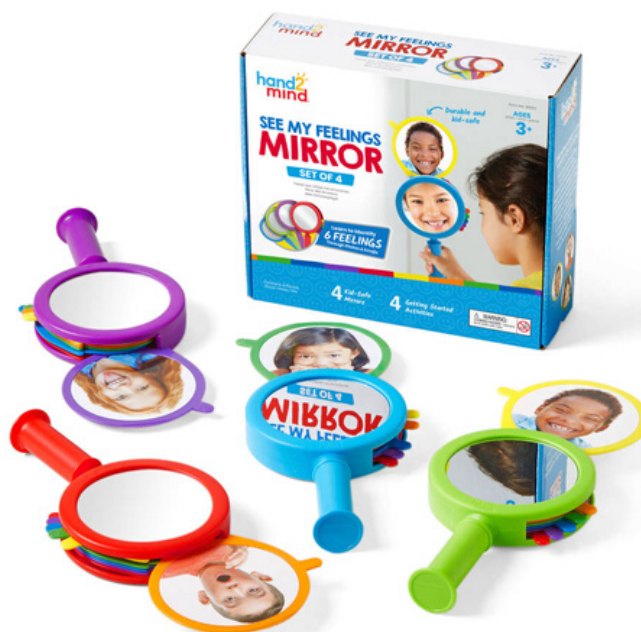
91293 Зеркало эмоций "Моё настроение" 4 зеркала