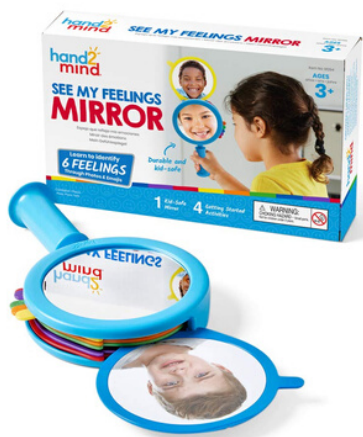
91294 Зеркало эмоций "Моё настроение" 1 зеркало

Развивающее пособие "Зеркало эмоций" поможет ребенку взглянуть со стороны на себя и, как следствие, научиться лучше понимать других .