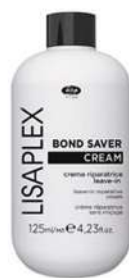
Lisaplex™ Bond Saver Cream