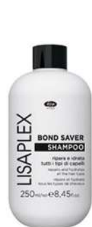
Lisaplex™ Bond Saver Shampoo