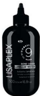
Lisaplex™ Bond Saver Lamellar Water