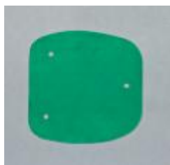
Рис. 2. Отверстия делают в трёх местах.