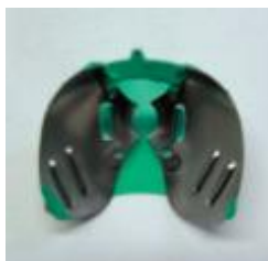
Рис. 9. ...готово для пробивки.