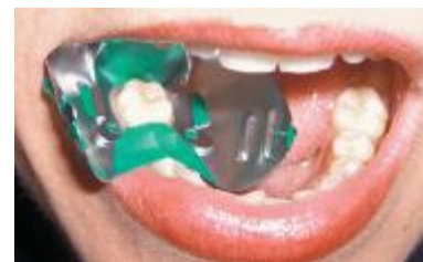
Рис. 11. Собранное зажимное устройство «Super Clamp» на месте.