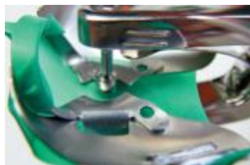
Рис. 10. Пробивка в кофердаме отверстия для зуба.