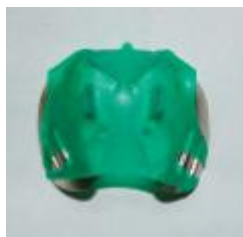
Рис. 8. Зажим в сборке с кофердамом.