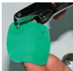
Рис. 1. Перфорация кофердама.