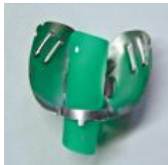
Рис. 3. Кофердам протягивают под пружину зажимного устройства.