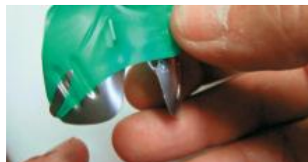
Рис. 7. ...и на указателях, расположенных на краях крыльев