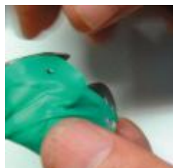
Рис. 6. Закрепляют нижние отверстия кофердама.