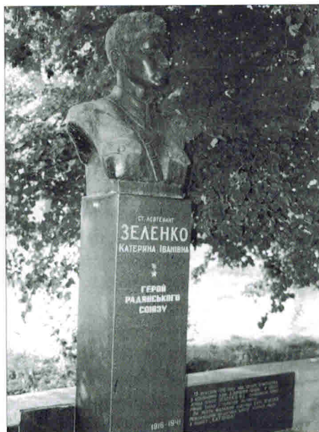
Бюст летчицы — старшего лейтенанта Е. И. Зеленко