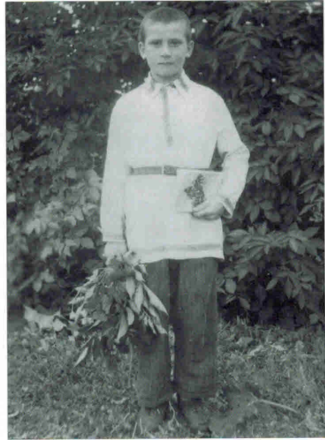
Мне уже 12 лет