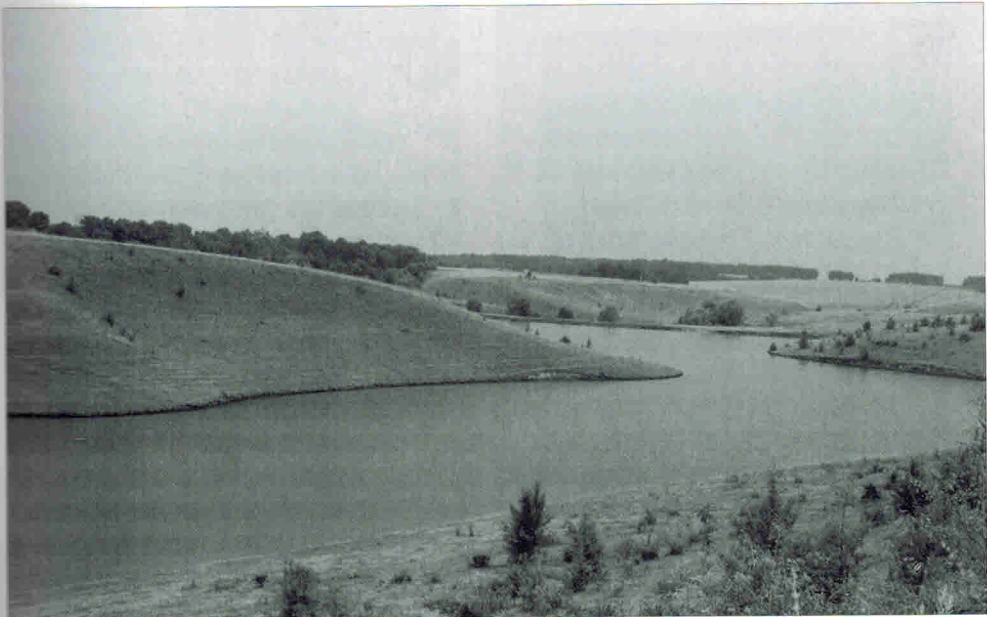
Анастасьевка, р. Артополот, которая впадает в Сулу