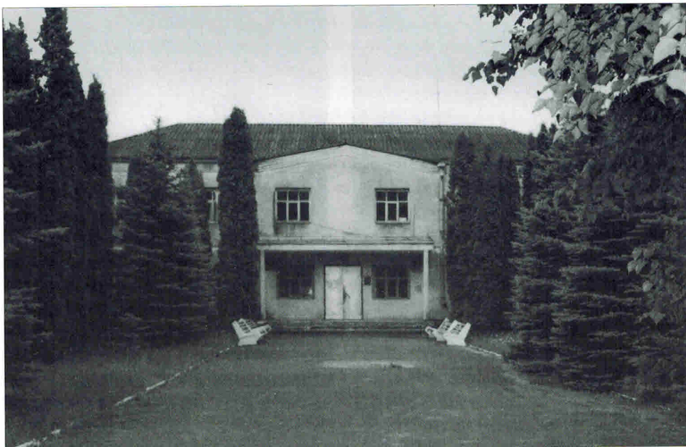
Здание сельского совета и управления колхоза им. М. И. Калинина в с. Анастасьевка