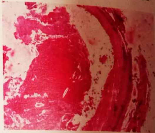
Фибрино-эритроцитарный тромб в ПМЖА