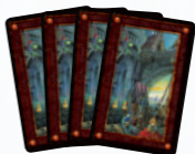
Игровая зона владельца короны