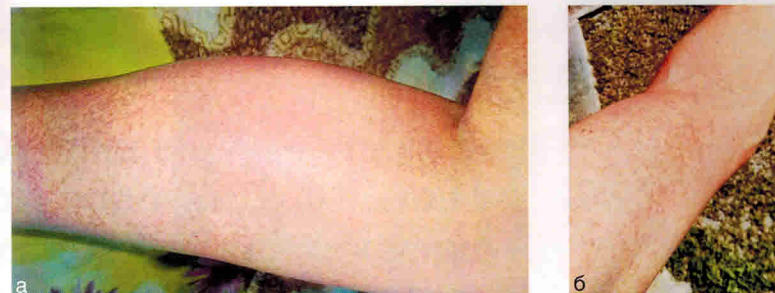
Рис. 4.2. Типичная сыпь при болезни Стилла взрослых