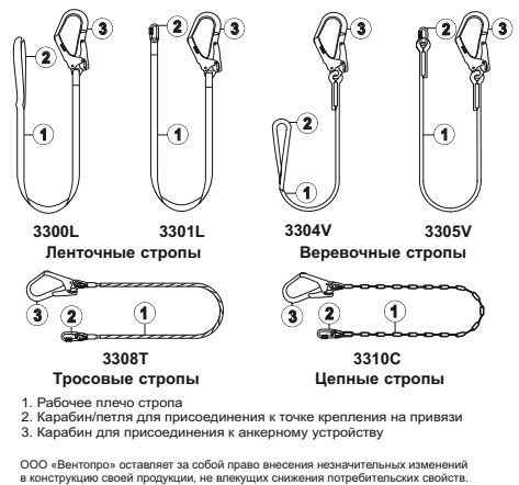
Рис. 2. Идентификация и маркировка изделия (пример)