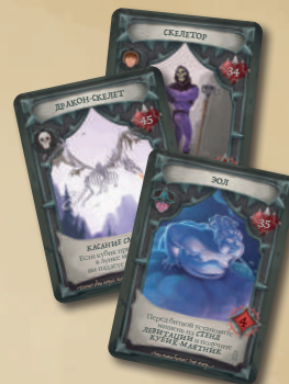
3 КАРТЫ БОССОВ