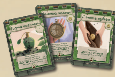
24 КАРТЫ СНАРЯЖЕНИЯ