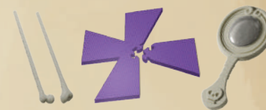
2 КОСТЯНЫЕ ПАЛОЧКИ, 1 СТЕНД ЛЕВИТАЦИИ, 1 ЛОРНЕТ ДУХОВИДЦА