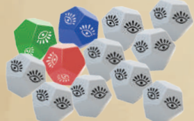
12 ДВЕНАДЦАТИГРАННЫХ КУБИКОВ (3 ЦВЕТНЫХ + 9 БЕЛЫХ БОНУСНЫХ)