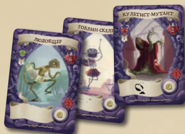
21 КАРТА МОНСТРОВ