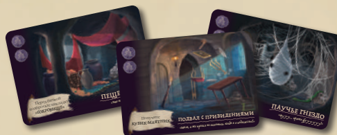
21 КАРТА ПОДЗЕМЕЛЬЯ