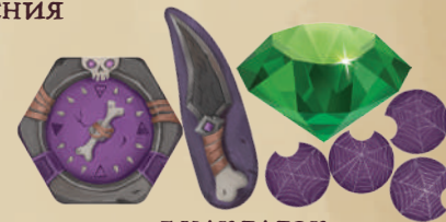
7 НАКЛАДОК (1 КОМПАС, 1 НОЖ В СПИНУ, 1 СОКРОВИЩЕ, 4 ПАУТИНЫ)