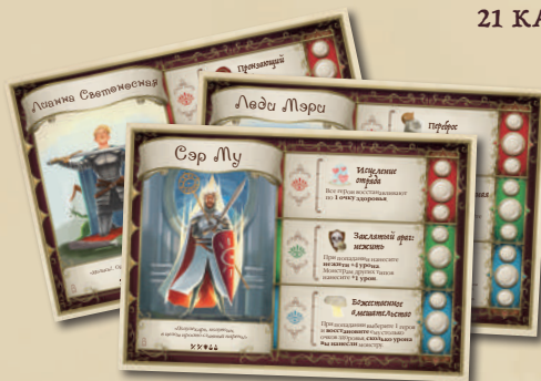
4 ПЛАНШЕТА ГЕРОЕВ