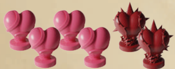
4 ФИШКИ ЗДОРОВЬЯ ГЕРОЕВ 2 ФИШКИ ЗДОРОВЬЯ МОНСТРА