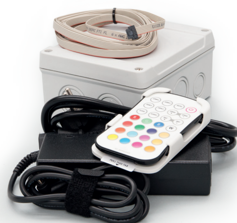
mit 6-Pin Steckverbinder