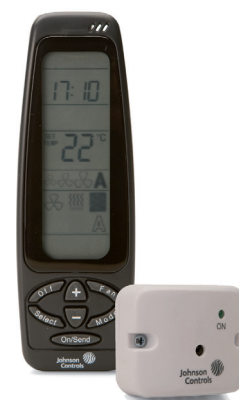
LP-RSM003-003C и LP-RSM003-004C