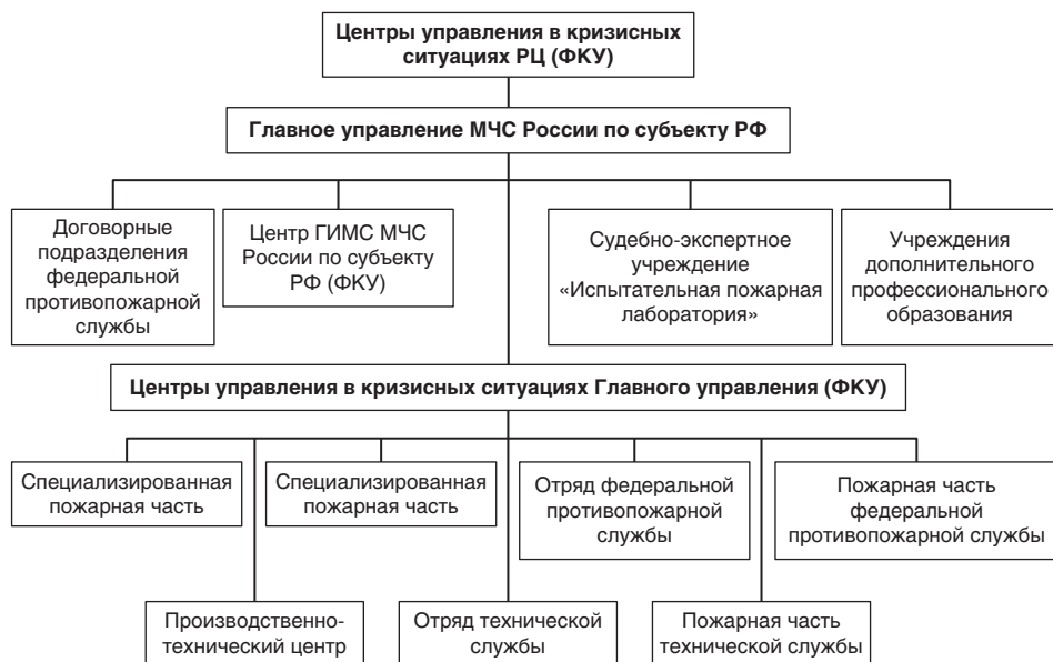
Рис. 1.2. Структура Министерства Российской Федерации по делам гражданской обороны, чрезвычайным ситуациям и ликвидации последствий стихийных бедствий (центры управления в кризисных ситуациях): ГИМС МЧС — Государственная инспекция по маломерным судам Министерства Российской Федерации по делам гражданской обороны, чрезвычайным ситуациям и ликвидации последствий стихийных бедствий; РЦ — Региональный центр ФКУ — федеральное казенное учреждение