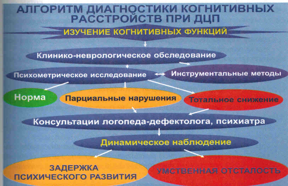
Рис. 4. Алгоритм диагностики когнитивных расстройств при ДЦП

Основными принципами диагностики когнитивных нарушений при ДЦП являются (Абрамович-Лехтман Р.Я., 1965; Симонова И.В., 1970; Марковская И.Ф., 1987; Мастюкова Е.М., 1989; Мамайчук И.И., 1992; Смирно-